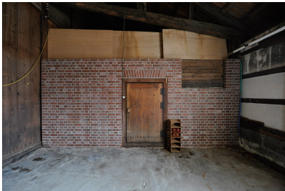
レンガの多用は深谷の酒蔵共通の特徴