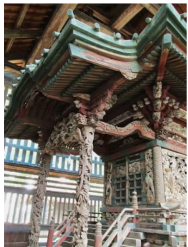
横瀬神社本殿彫刻

絶賛された。 時代先取り、セルフの丸山ス タイルが活きたのが、翌年2月、 緑の王国「梅まつり」での「深 谷カルソツ」。泥付きねぎを 参加者が自分で焼いて食べる深 谷カルソツは2013年に瀧 宮神社で行われた「深谷ねぎま つり」を産み、アクア・パラ ダイスに移った今年1月の開催で は1万5000人を集めるビッ グイベントに成長している。