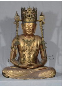
大日如来坐像 (華蔵寺美術館)

勢いは止まらない。同年10月 には同会主催、丸山酒造はじめ 深谷の酒蔵と漬物生産者、レス トランがコラボした第1回「漬 物・酒BAR」が国済済のラヴィ ス・ヴィラ・スイートで開催され ている。以降漬物・酒BARは 回数を重ね、今年4月6日には 深谷の新名所深谷テラスパーク で開催された。