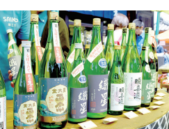
新酒も楽しめる 「のみくら〜べ」には 毎回長い行列